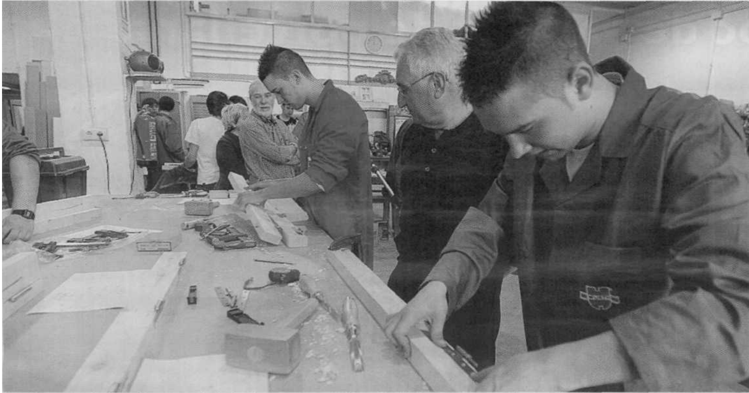
Los alumnos trabajaron durante más de dos horas para completar el trabajo propuesto por la organización. CRISTÓBAL CASTRO