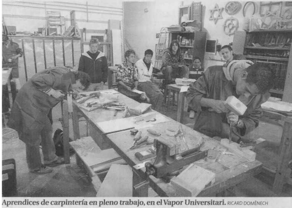
Aprendices de carpintería en pleno trabajo, en el Vapor Universitari. RICARD DOMÈNECH

UN ALUMNO DE 34 AÑOS SE IMPUSO EN EL CERTAMEN