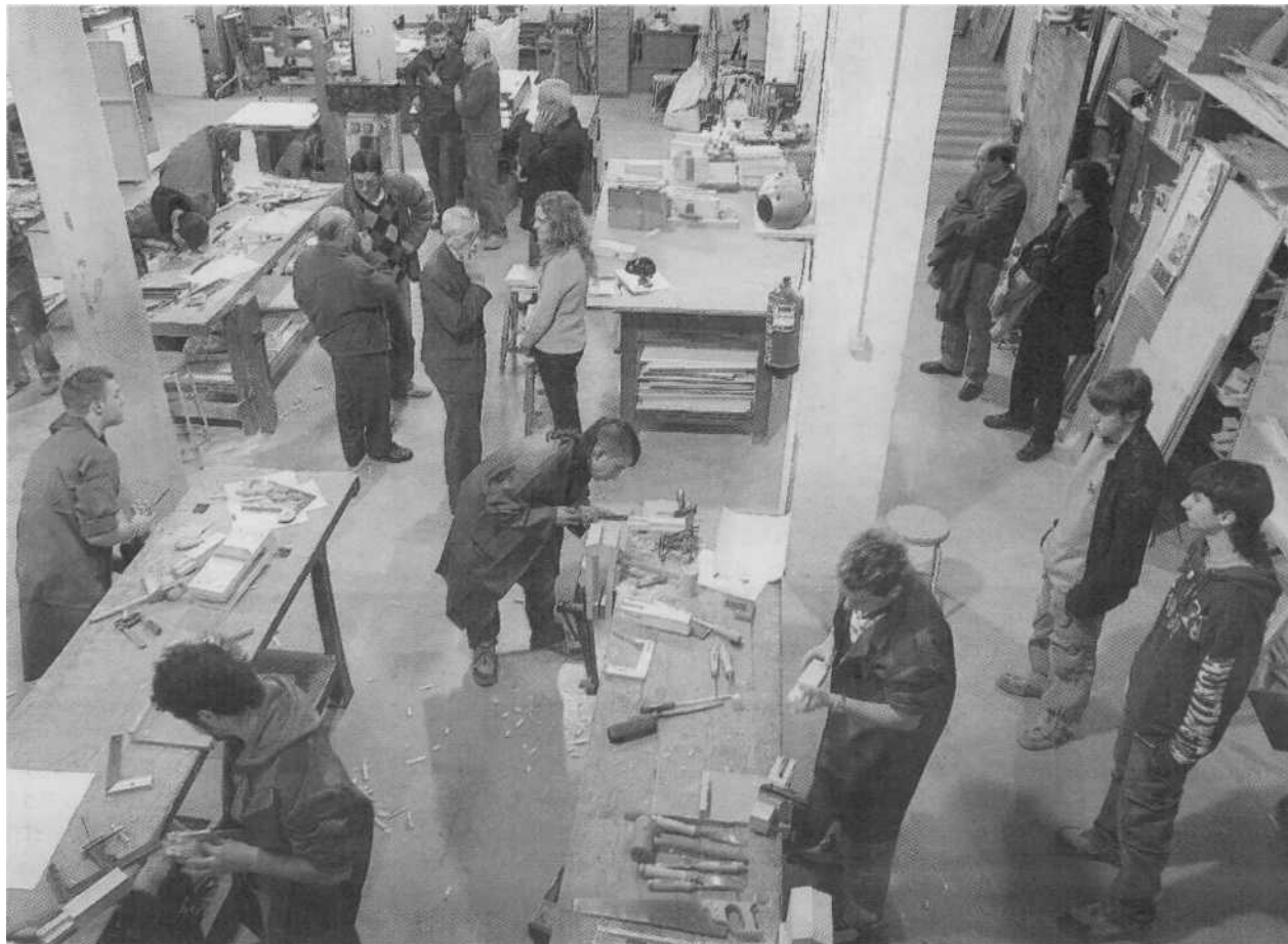
El certamen se celebró en el taller de la Escola Municipal d'Art de Terrassa, en el Vapor Universitari.